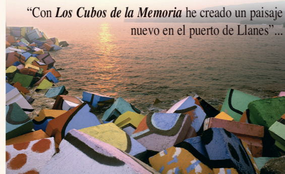
“Con Los Cubos de la Memoria he creado un paisaje nuevo en el puerto de Llanes”...

“Será mi obra más poderosa”... Agustín Ibarrola (Bilbao, 1930)