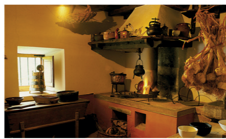
Museo Etnográfico del Oriente de Asturias